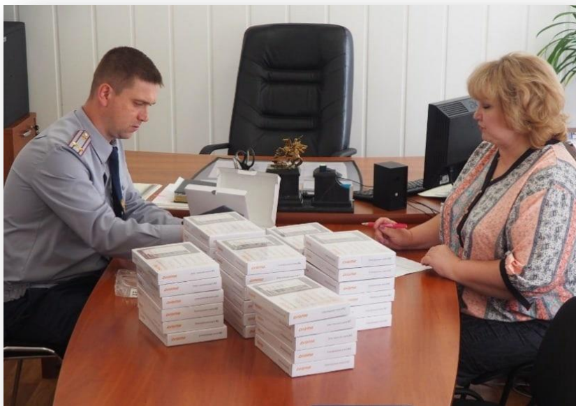
100 экземпляров – электронные книги